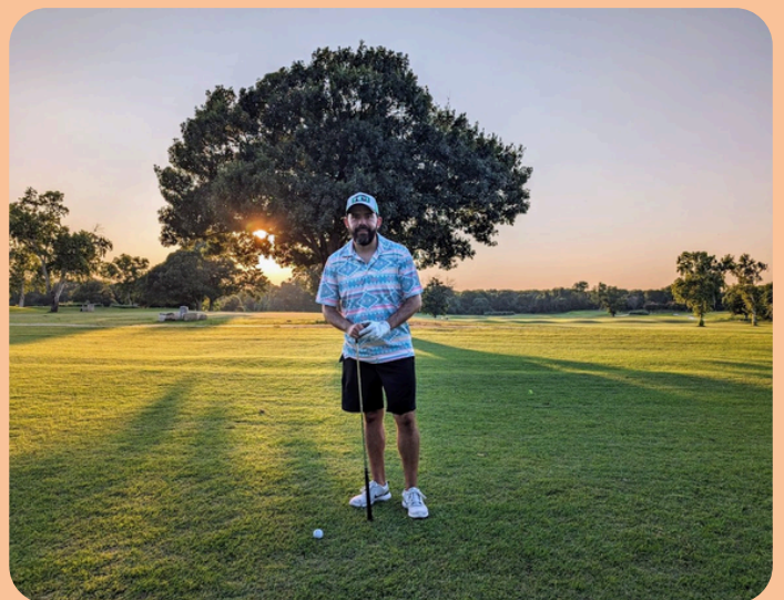
Antes de fallar el tiro