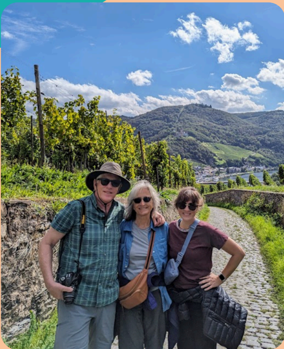
Región vinícola de Alemania!