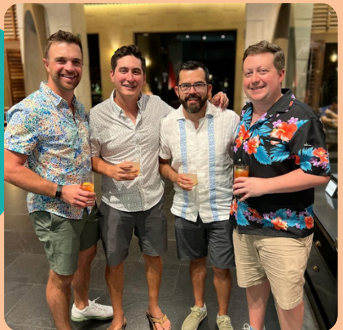
De viaje a Cancún con amigos