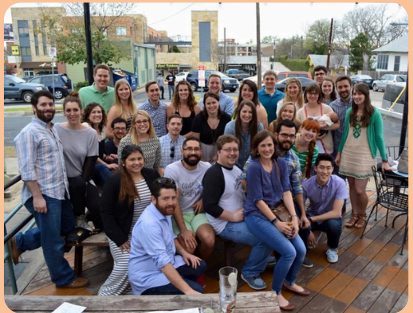
Celebrando nuestro compromiso con amigos