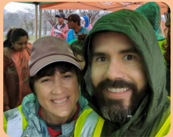
Plantando árboles bajo la lluvia