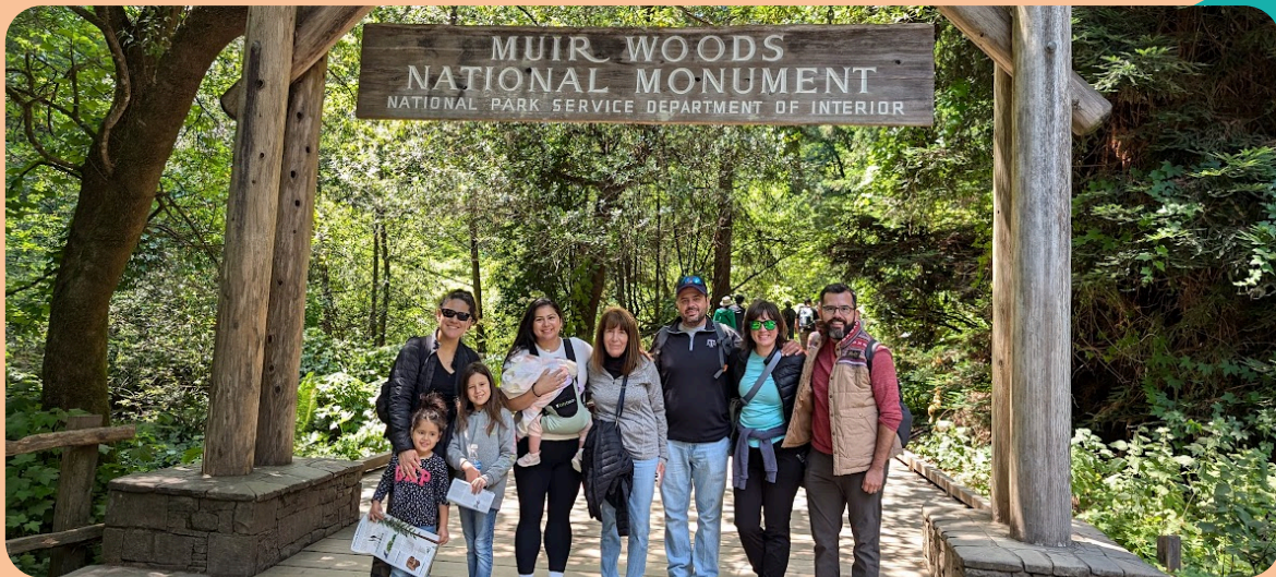
Visitando el Bosque Muir