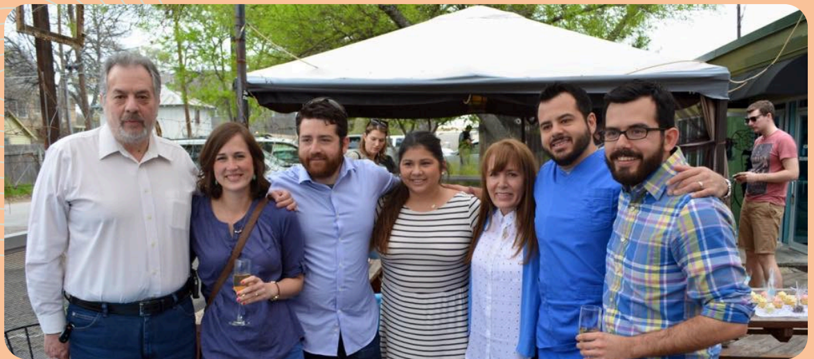
Nuestra celebración de compromiso