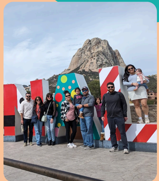
Vacación en familia a Peña de Bernal