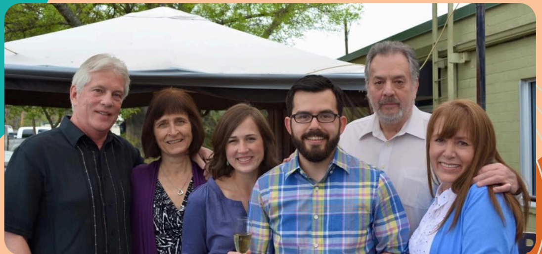
Nuestros padres en nuestro compromiso