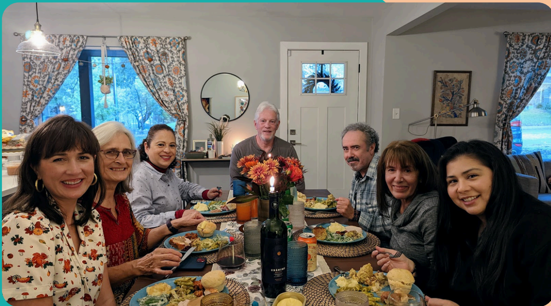
Nuestras familias en el día de acción de gracias