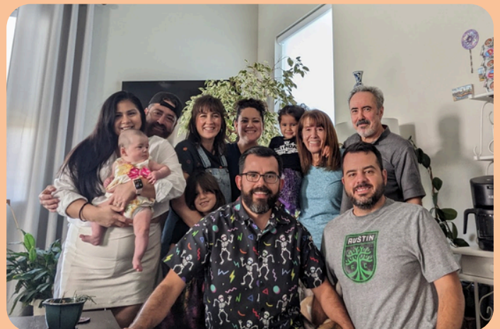
Izquierda: Cena de cumpleaños en nuestra casa