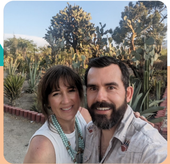
De viaje a Oaxaca