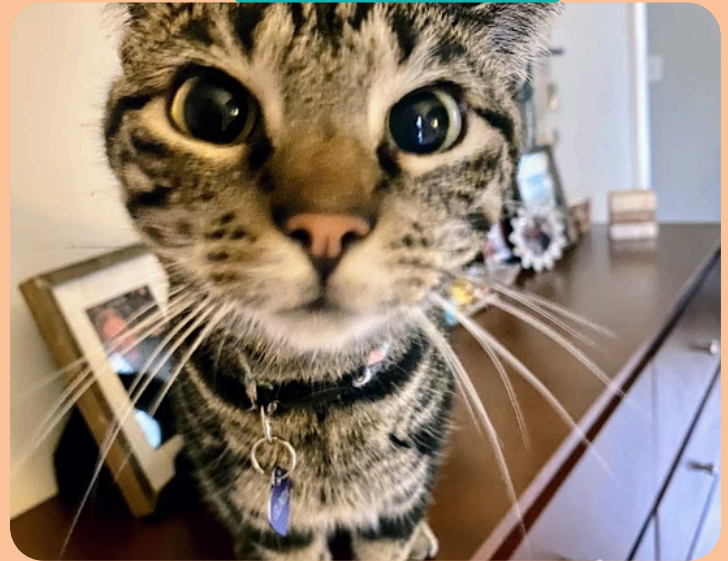
Glinda , la reina de la casa