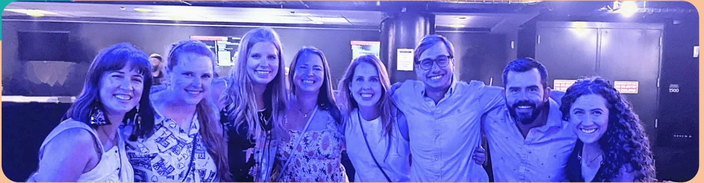
En un concierto de The Head & the Heart con nuestros amigos

Cuando no estamos de vacaciones, pasamos nuestro tiempo libre escuchando música en vivo, haciendo caminatas y como voluntarios de "TreeFolks" (una organización local de plantación de árboles). Ambos somos "súper voluntarios", lo que significa que podemos liderar eventos y difundir con positividad todos los beneficios que los árboles brindan a la sociedad.