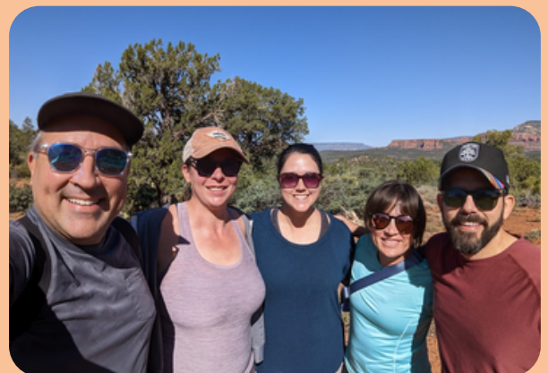
Reunión de amigos veterinarios en sedona