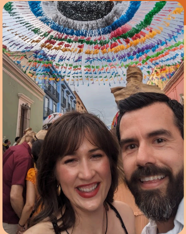
Durante una calenda en Oaxaca