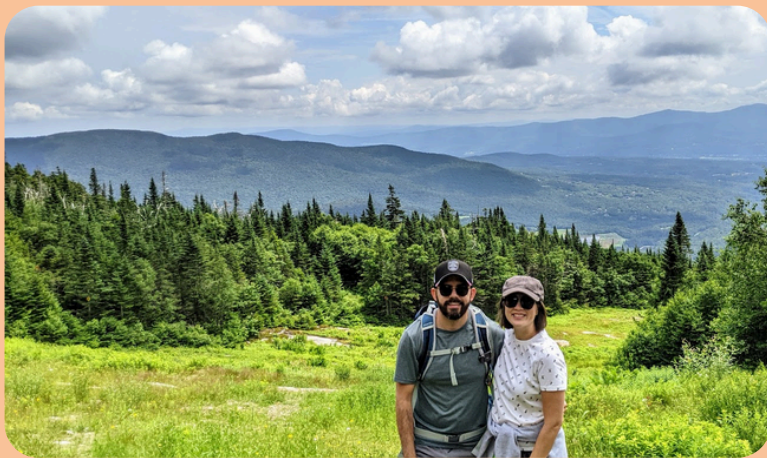
Senderismo en Vermont